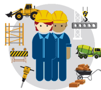
ZEDNÍK PRÁCE NA STAVENIŠTÍCH