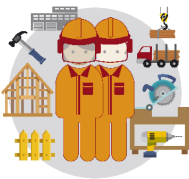
TRUHLÁŘ OBRÁBĚNÍ DŘEVA