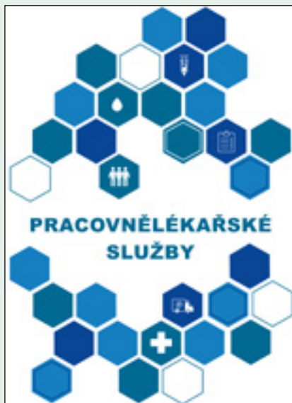
Obálka publikace Pracovnělékařské služby

© Výzkumný ústav bezpečnosti práce, v. v. i., 2021